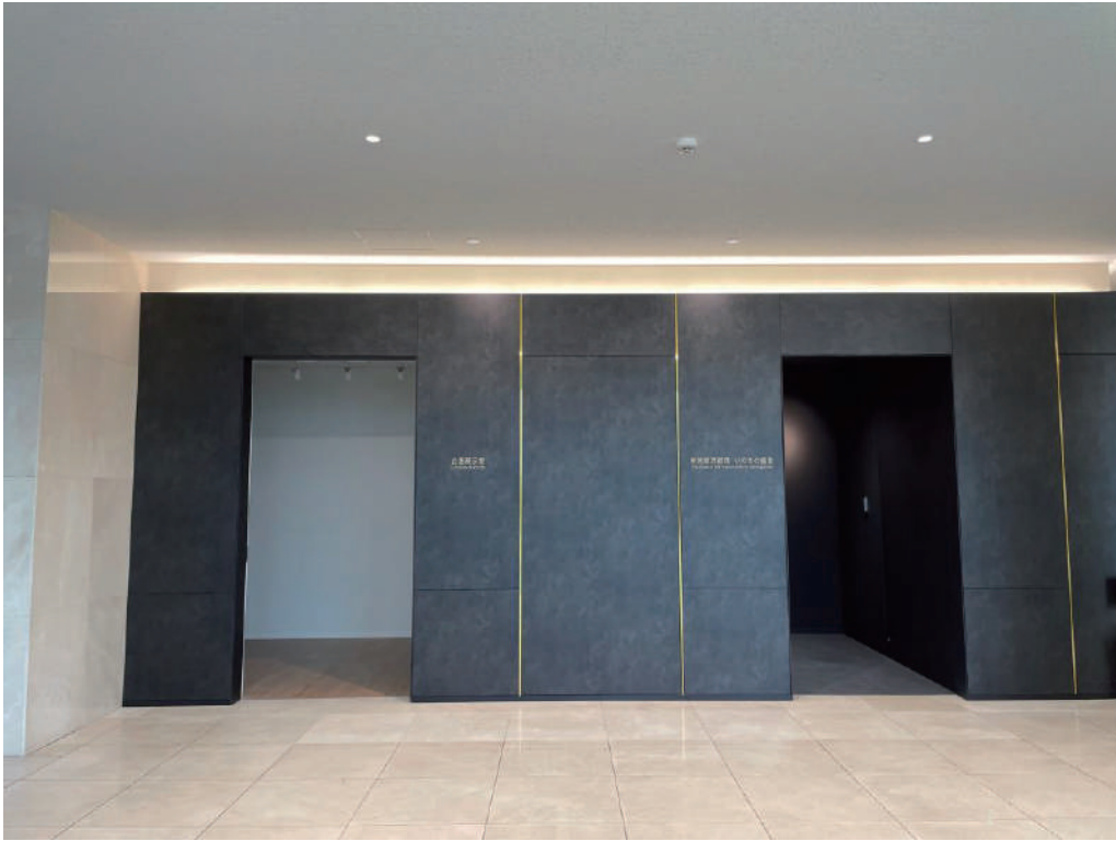
企画展示室 入口（左側）