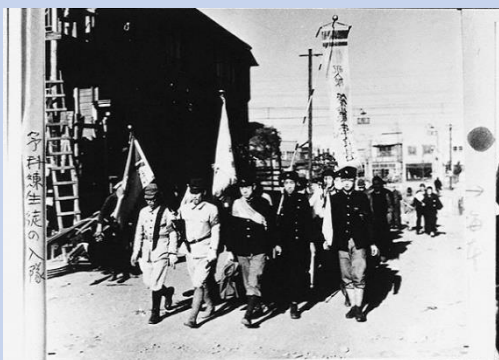
参考資料：予科練習生として土浦航空隊に入隊する少年

活動を始めてから、全国各地の資料館を訪れました。その中でも鹿児島県の ちらん 知覧特攻平和会館で見た、特攻兵の残した手紙には身が引き締まる思いがしました。私が戦争の歴史に関心を持ったきっかけが「特攻」だったこともあり、今回この資料を選定させて頂きました。