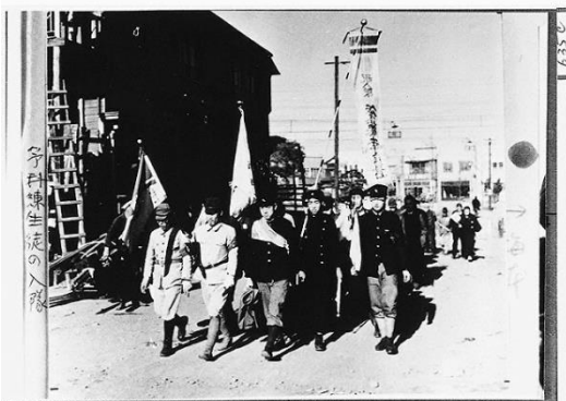
参考資料:予科練習生として土浦航空隊に入隊する少年 国際平和ミュージアム 梅本忠男写真集

活動を始めてから、全国各地の資料館を訪れました。その中でも鹿児島県の知覧特攻平和会館 ちらん で見た、特攻兵の残した手紙には身が引き締まる思いがしました。私が戦争の歴史に関心を持ったきっかけが「特攻」だったこともあり、今回この資料を選定させて頂きました。私は特攻