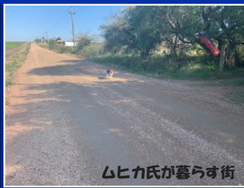
ムヒカ氏が暮らす街