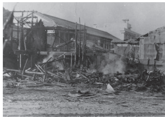
参考：修道学区馬町附近被爆跡（1945年1月16日）

参考文献 水島朝穂・大前治 2014、『検証防空法 - 空襲下で禁じられた退避』法律文化社。 戦争遺跡に平和を学ぶ京都の会 2010、『語り継ぐ京都の戦争と平和』つむぎ出版。