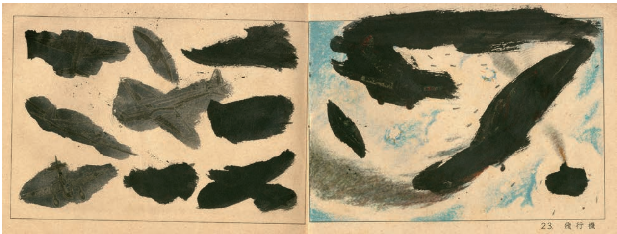
初等科図画1 (墨塗教科書)