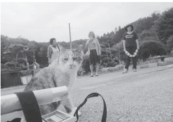
猫も放射線測定器に興味をもっているように見えました。

私たち「福島プロジェクト・チーム」は、「事態を侮らず、過度に恐れず、理性的に向き合う」を合言葉に、訪れた場所の状況に見合った実践的な被曝低減方法を提案していますが、イノシシの糞の放射能は改めて「事態を侮らず」という視点の大切さを教えているようでした。しかし、伝え方によっては放射能汚染に対する危機感を過度に刺激し、不安を増長する可能性があります。さて、どう伝えましょうか？