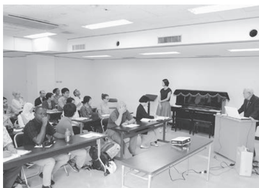
長崎で被爆者の講演を聞く参加者

去」の教訓から分析できるともいえる。このような分析力を向上させ、その成果を教育、研究、展示活動を通じて社会に広めることを念頭に置き、今回、イギリスのリバプール大学(University of Liverpool)と共同で日英12大学の共同体「RENKEI」※1による大学院生向け短期集中型スクーリング・プログラムを企画・実施したところである。