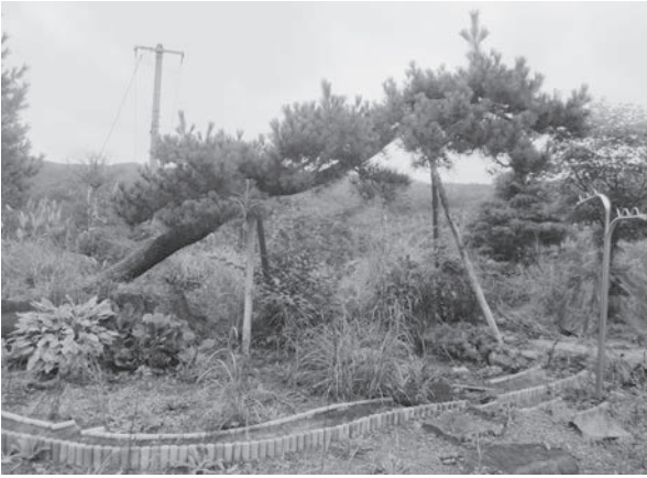
飯館村の民家の松の木肌にも、汚染が残っていました。移植の希望にどう応えるかが課題です。