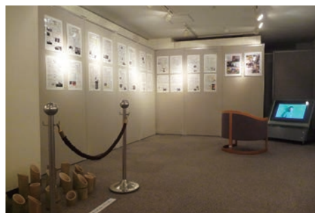
昨年度の展示の様子（守山中学校・高等学校）

立命館の初等・中等教育段階での「平和・人権・地球市民教育」の実践内容を紹介することを通じて、今日の小学生・中学生・高校生の平和・人権・環境などの課題に対する意識、現代社会や世界との関わり方に対する認識を知ってもらおうとするものです。ミュージアムに来館する児童、生徒の皆さんや一般の方々に改めて平和を考える機会となればと考えています。