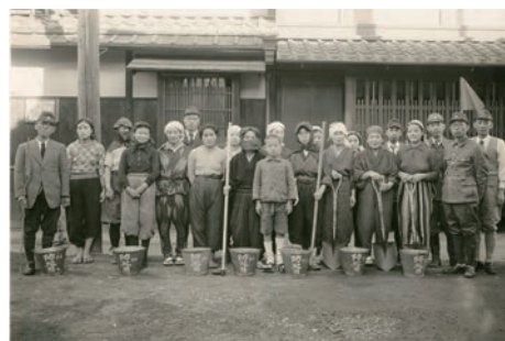
防空演習・上京区衣棚通今出川上

内容：防空法による統制や建物疎開、京都への空襲計画、体験者の証言や資料などのテーマから、京都の空襲について紹介します。