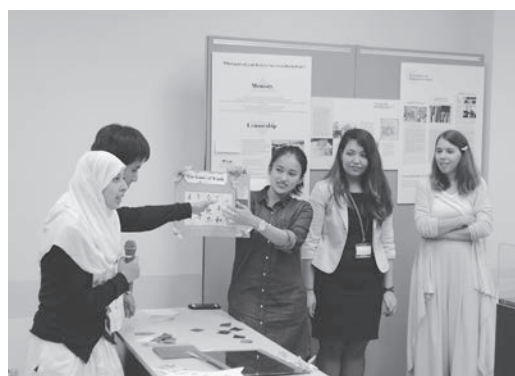
院生たちのプレゼンテーション

感想が出されており、平和のメッセージを広めることにつながると思われる。立命館のミュージアムをPBLの学習現場として活用し、大学院の短期留学生を受け入れる学際的なプログラムを展開する可能性も考えられる。今回、総合先端学術研究科、国際関係研究科、映像学部、ゲーム研究センターおよび政策科学部がこのプログラムに教員と院生を派遣した。また、立命館大学と立命館アジア太平洋大学の学術交流関係の強化も図られた。実施の事務体制も、日常の垣根を越え、学術情報部（国際平和ミュージアム）と総合企画部（国際連携課）の協力の下で取り組まれ、学術効果が高まったと言える。